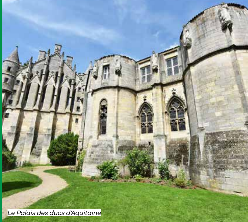
Le Palais des ducs d'Aquitaine