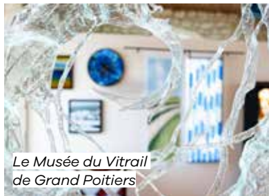
Le Musée du Vitrail de Grand Poitiers

Le Musée du Vitrail de Grand Poitiers est l'une des rares structures consacrées au vitrail en France. Installé de-