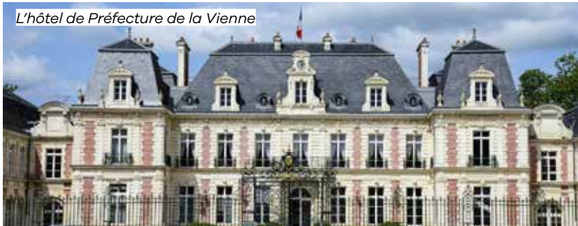
L'hôtel de Préfecture de la Vienne

© Devant les grilles de la Préfecture, place Aristide-Briand – Poitiers