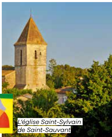
L'église Saint-Sylvain de Saint-Sauvant