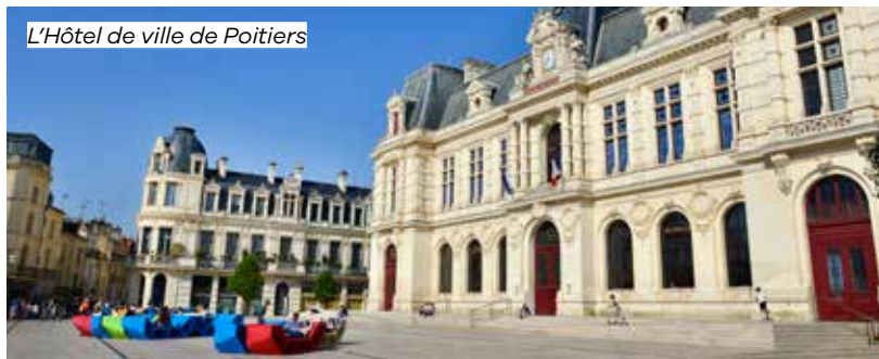
L'Hôtel de ville de Poitiers