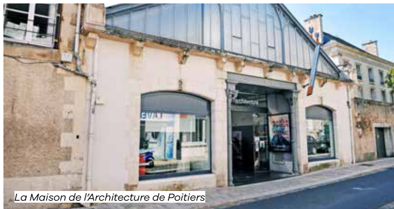
La Maison de l'Architecture de Poitiers

Découvrez cette architecture de la fin du 19 e siècle, une réhabilitation d'un ancien garage en lieu culturel, un des rares réemplois de bâtiment industriel en centre-ville de Poitiers.