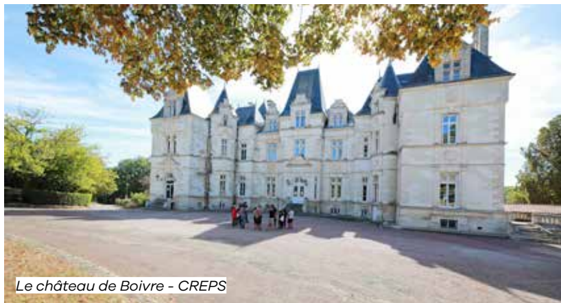
Le château de Boivre - CREPS

📍 Devant le château, route de la forêt Vouneuil-sous-Biard