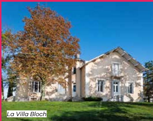
La Villa Bloch

Départ toutes les heures. Durée : 45 minutes. Dernière visite à 17h. Groupe limité, inscription préalable et obligatoire à partir du lundi 7 septembre, au 05 49 30 81 94.