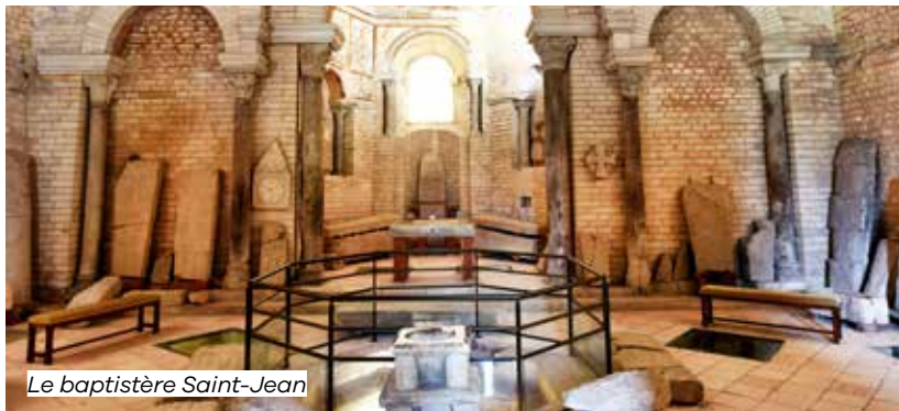
Le baptistère Saint-Jean