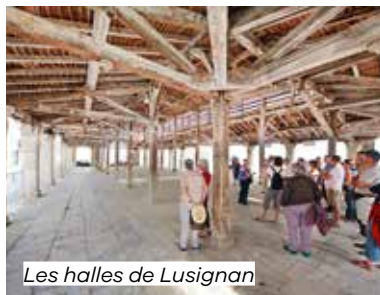
Les halles de Lusignan

📍 Rue Saint-Louis (place des Halles) Lusignan