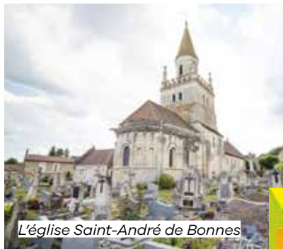
L'église Saint-André de Bonnes