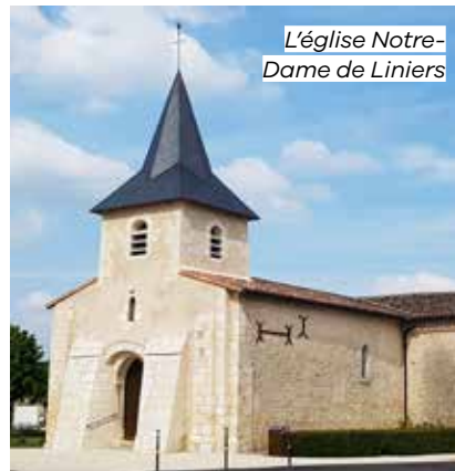
L'église Notre-Dame de Liniers