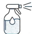
Je mouille mon corps