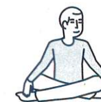
Je fais des activités sans effort