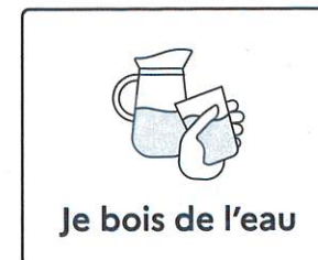
Je bois de l'eau