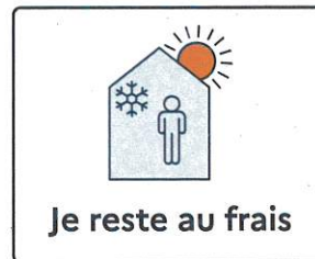
Je reste au frais