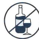
J'évite de boire de l'alcool